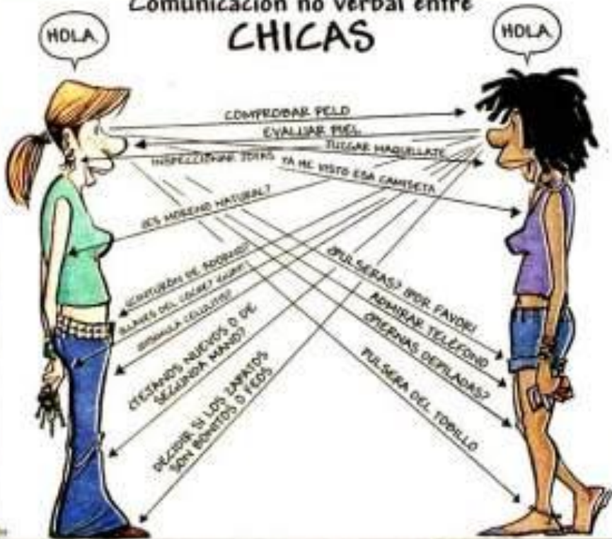
Comunicación no verbal entre CHICAS