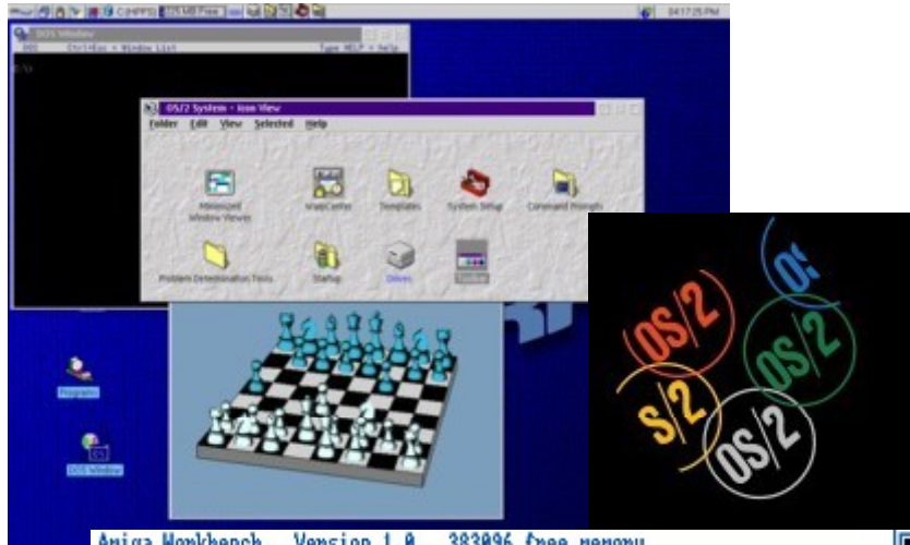
Aniga Workbench. Version 1.0. 383096 free memory