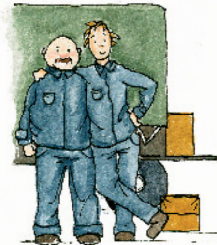
Mossos de càrrega