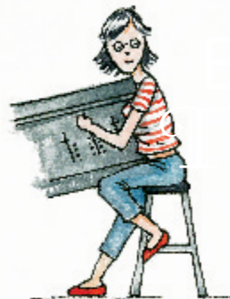
Tècnica de so