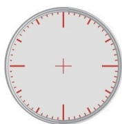
La broca curta indica l'hora:

En altres models només es marquen els punts 12 – 3 – 6 – 9 (que coincideixen amb els quarts)