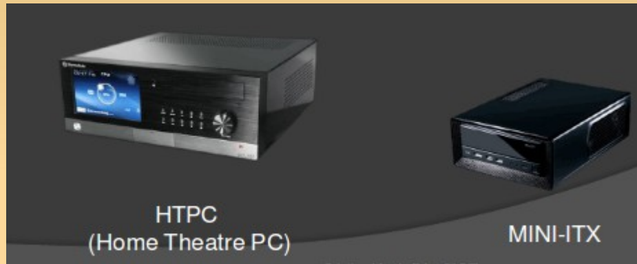
HTPC (Home Theatre PC)